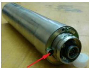
Рис. 11. Место пломбирования блоков БД-6-1, БД-6-1Д, БД-6-5, БД-6-5Д

Ниже на рисунках 11-13 стрелкой показаны места пломбирования блоков