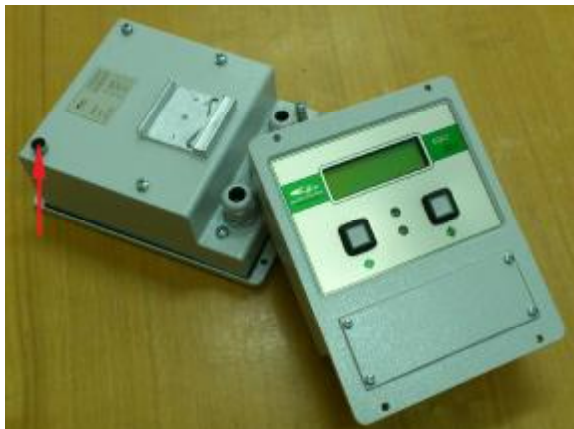
Рис. 13. Место пломбирования блока БОИ-4