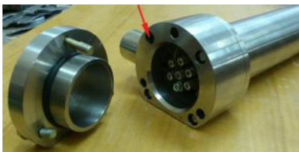
Рис. 12. Место пломбирования блоков БД-7-1, БД-7-1Д, БД-7-5, БД-7-5Д